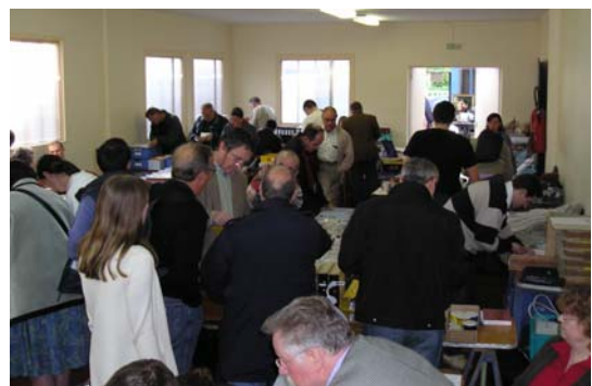
une vue de la salle de vente

La dernière exposition vente de l'AMT qui s'est tenue le samedi 30 avril 2005 a permis de recueillir la somme de 1590 €